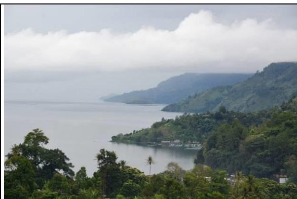
全東南亞最大的火山湖 - Lake Toba