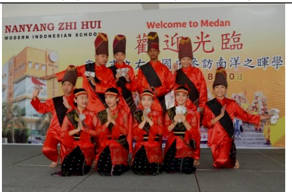
壓軸表演—馬達族傳統舞蹈，同學表演樂開懷