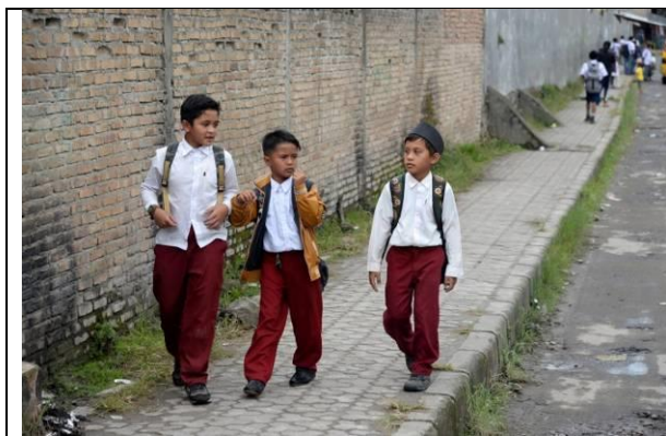
印尼的學生制服很多是白上衣、紅褲子

前往 絲比索瀑布 的路上，沿途可見許多公立學校，學生觀察到印尼的學生制服很多是白上衣、紅褲子或紅裙子呢！導遊解釋這跟國旗顏色是有關係的。