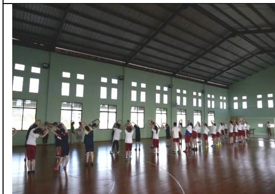
南洋之暉學校室內綜合體育館