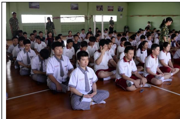
參加南洋之暉的特色課程~靜坐

學生住到接待家庭才一晚，有人已有深刻感受：「我的接待家庭離學校很遠，車程大約30分鐘。他們家是在一片高級住宅區內，不但有保全還要刷卡才能進去。但出來沒多久就是印尼平民住的地方，隨處可見在路上乞討的乞丐，還有必須自己走路回家的一般學生們，貧富差距真的太大了。看了這些才深刻體會到自己有多麼幸福，不但能出國玩，還能夠吃得飽穿得暖，到哪裡還有車接送，我想這就是身在福中不知福的最佳代表。」