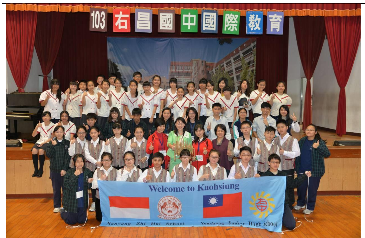
103年12月接待印尼南洋之暉學校16位師生到台灣參訪合影

歷經行程之規劃、招標採購、兩校網路聯絡細節、行前準備與集訓等，右中師生於 104 年 8 月 5 日抵達位於印度尼西亞北蘇門答臘省的首府，也是印尼第三大城棉蘭的南洋之暉學校回訪 10 日，實地參訪以增進兩校友誼，受到姊妹校師生熱烈歡迎。本校學生透過親身體驗不同地域、國情與生活習慣等過程，達到增廣見聞、開拓視野、培養外語能力等實際效益；而在多元文化的交流學習機會下，更激發出跨文化比較的觀察力與反思力，達到培養寬廣世界觀的主要目的。