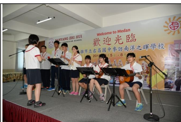
演奏南洋之暉的校歌，在場氣氛和樂