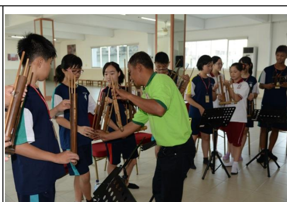
體驗印尼的竹製傳統樂器“昂克隆”