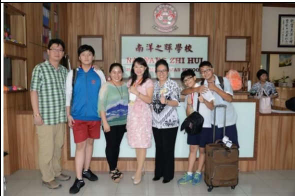
在接待家庭接受照顧，感覺有了第二個家