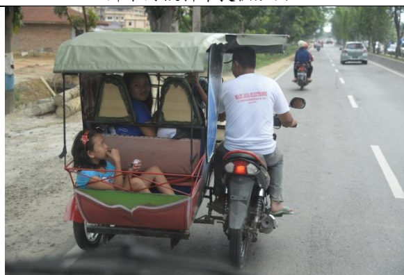
印尼的車子是靠左行駛的(右駕)