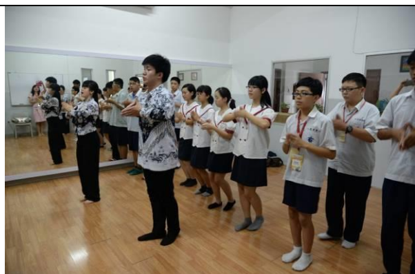
馬不停蹄來到教室再次學習馬達族舞蹈