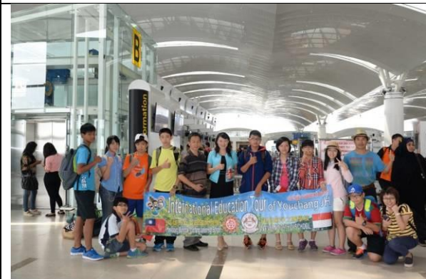
快樂時光過得特別快，又回到了機場