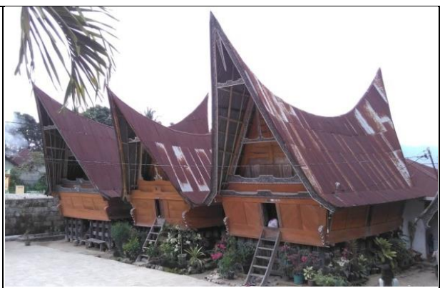
加保民族的傳統住屋，能見到牛角型的屋頂及為了進入屋內的架梯。