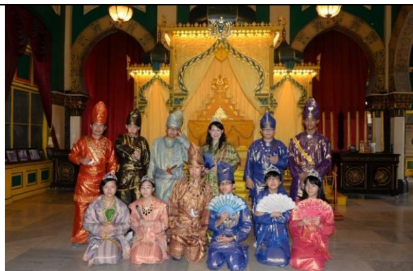
穿著傳統服飾，像是王宮貴族一般！