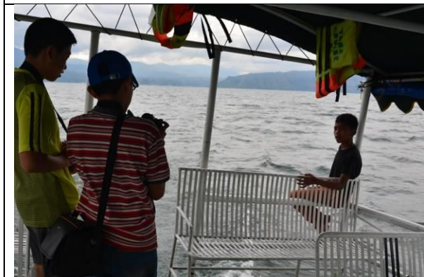
看到小男生辛苦工作，讓學生感觸良多