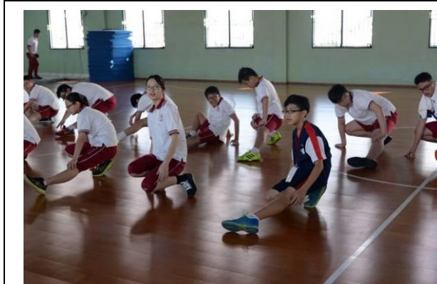
學生跟著上體育課，一同做操、跑步