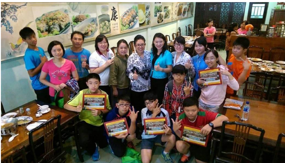
在印尼的最後一餐，感謝南洋之暉的老師們！