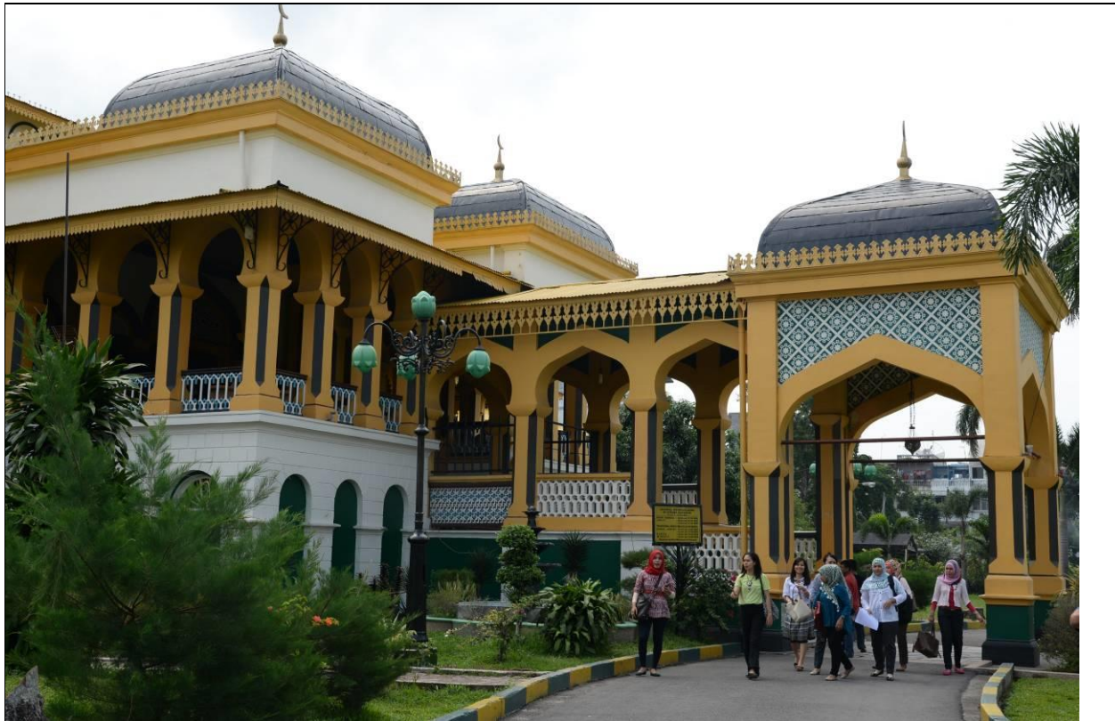
棉蘭市區內的蘇丹行政宮部分，雖為印尼的行政人員行宮， 但此建築為荷蘭人所造，故西式建築氣息濃厚。

印尼人為能夠有效阻擋雨水侵入，選擇以斜屋頂的方式；台灣的傳統建築型態，不採用屋頂擋雨的方式，而使用「騎樓」來遮風避雨。台灣雖然也是雨水豐沛，但卻不常見到像印尼這般的「高腳屋」，傳統的房屋也以「三合院」為主。