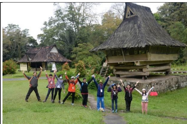
參觀古代君王住的房子~西馬倫根王長屋