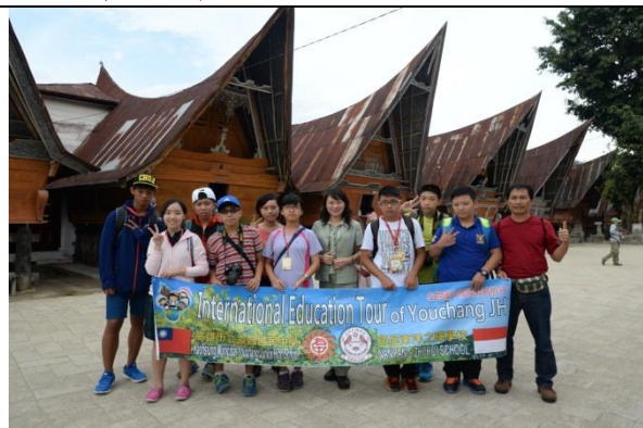
米南加保族的住屋參觀

下午一時許，才得以抵達午餐處，隨後導遊安排包船前往夏夢詩島觀光。「在我們坐的船上有兩個小男生在幫忙，經導遊一問才知道，他們居然一個只有 12 歲，一個 14 歲而已。看到他們那麼辛苦的工作，不禁讓我感到好愧疚，因為當他們在辛苦工作時，我們則在盡情享樂。」「坐船回程的時候，那兩個小男生突然跑到客艙唱歌賺小費，我覺得他們很厲害，