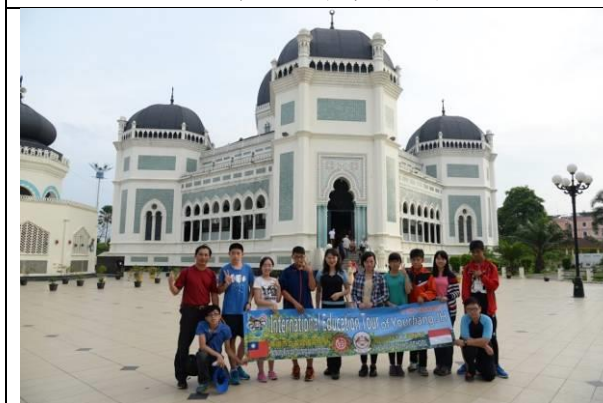
至棉蘭最有名的清真寺