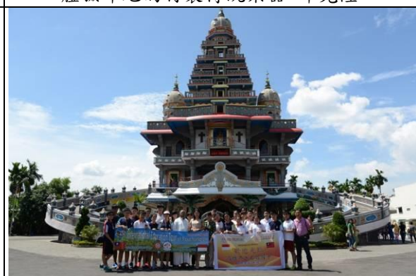
清真寺圓頂、佛教圖騰、多層次建築，令師生驚豔！