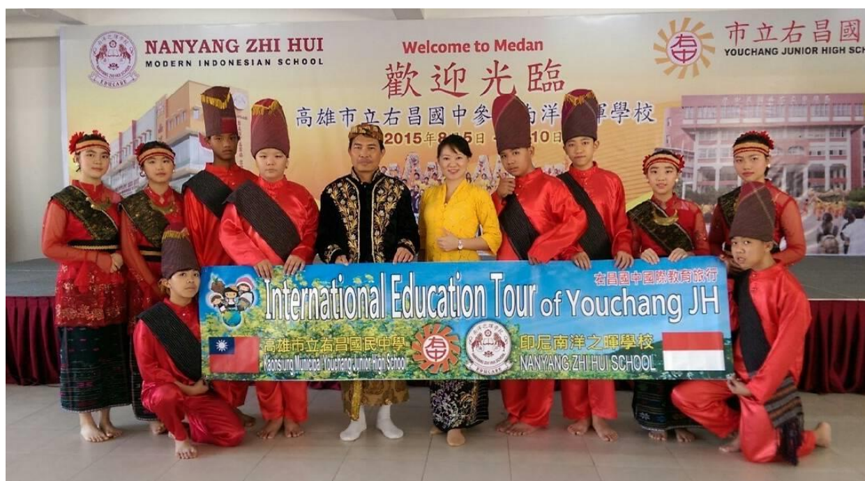
穿上馬達族傳統服飾的我們

最後，離別樂聲中，同學與寄宿家庭合影並交換紀念禮物，兩校師生也再度合照，距離初相見合影才三天，卻感到充實如三週。「感謝南洋之暉的所有老師及學生那麼隆重的招待，謝謝你們！」同學眼眶泛紅，不斷道謝。「就要離開這些老師同學了耶，我好捨不得喔……不過，我相信這片用友誼編織的美麗風景，一定會在心中開出最美麗的花朵，永不凋謝！」童同學如此形容著。