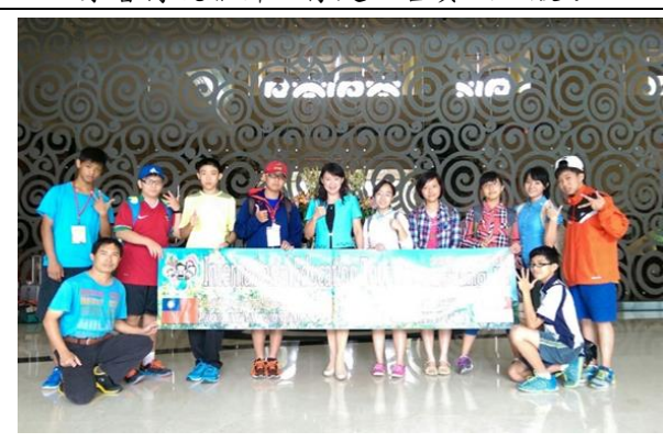
飯店華麗設施，令眾人驚嘆