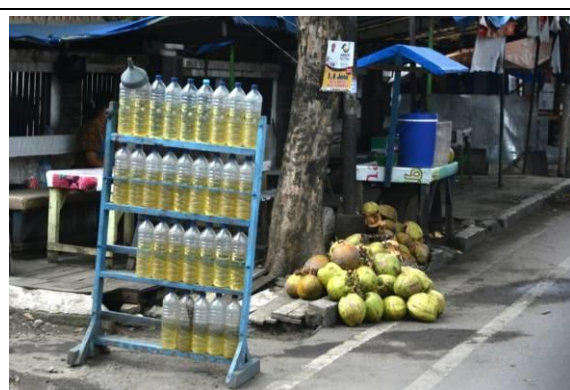
鄉下用飲料罐提供加油