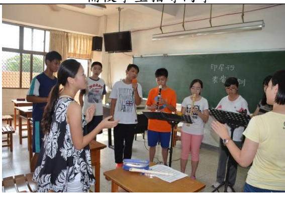
表演練習~邀請音樂老師指導