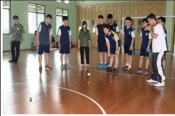
與學伴玩印尼傳統遊戲~“peach piring”

今天早上學生上了兩節體育課，先做操、跑步，然後與學伴玩像躲避球的印尼傳統遊戲~“peach piring”，運用一疊圓形卡片和一顆球分組競賽，一組負責丟球，把圓形卡片丟倒，另一組要把球追擊對方隊員，被丟到的出局，當丟倒的圓形卡片那組重新整理好卡片就贏了。該遊戲不僅達到運動效果，更需要團隊合作才能獲勝，是一個很有趣又不失教育性的活動。