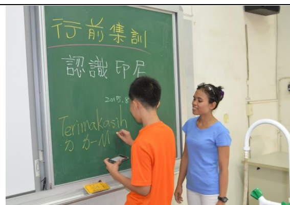
常用印尼語學習:邀請來自印尼的新移民 補校學生指導同學