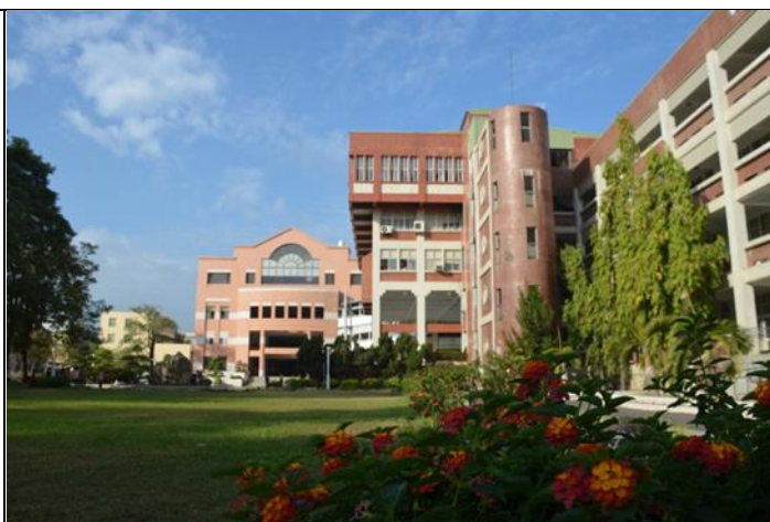
右昌國中地球科學園區一隅