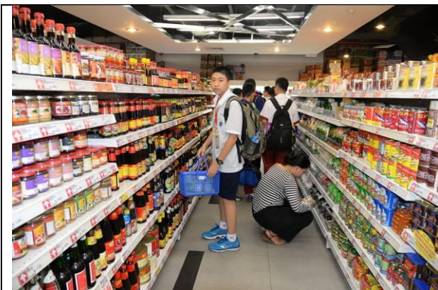
印尼胡椒、丁香、豆蔻、咖哩等各種香料調味種類繁多，令同學大開眼界

煎香蕉、炸丹貝、nasi timbel（大米包在香蕉葉裡）、sayur asem（酸味蔬菜湯）、參巴醬、糯米糰、魚肉丸、炒米飯及各種烤制糕點、涼拌什錦菜、什錦黃飯。