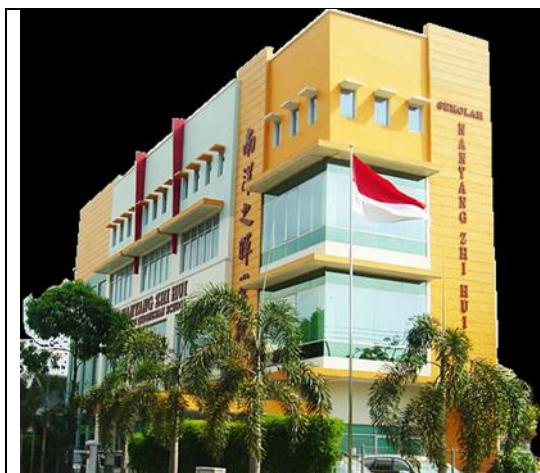
南洋之暉學校外觀

南洋之暉學校是嚴格禁止學生帶手機到校的，不像右中可以事先申請之方式帶來。另外南洋之暉的校園環境整潔且清淨，令人感到是舒服的學習環境。「希望未來還能有機會和南洋之暉學校交流，並且能向他們多學習！」學生如此結語。