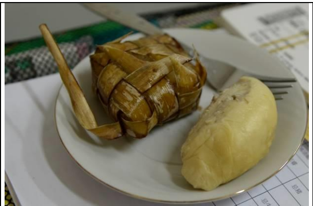
國際交流過程裡，也體驗了印尼的飲食