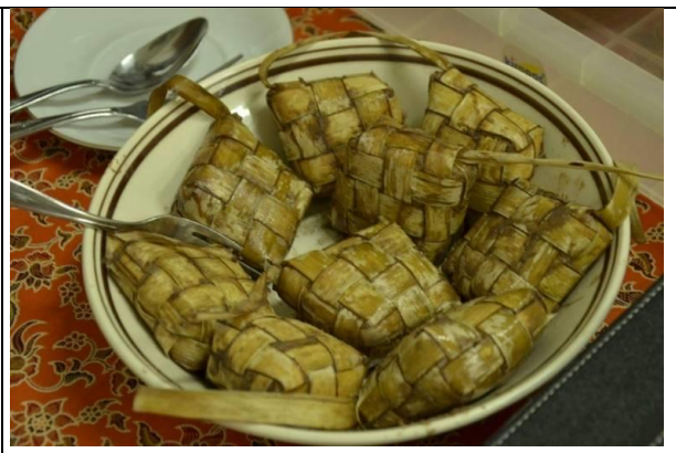
印尼的傳統美食-克杜巴，是用棕櫚葉把糯米包在裡面，包成菱形狀蒸熟吃。