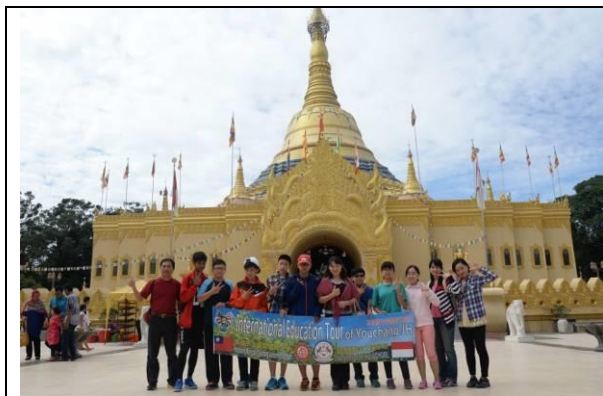
緬甸風之佛寺前合影

之高，原來它是南洋之暉訂製布置於舞台的歡迎海報(大圖輸出)，當時得知海報帆布將因我們離開而卸下，為留紀念特別情商惠贈。為了攜回台灣，師生還在大廳拆開重摺，它將跟著行李一起拖運回國，讓右中學生知道南洋之暉的盛情。