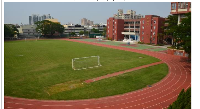
右昌國中 300m 跑道及操場