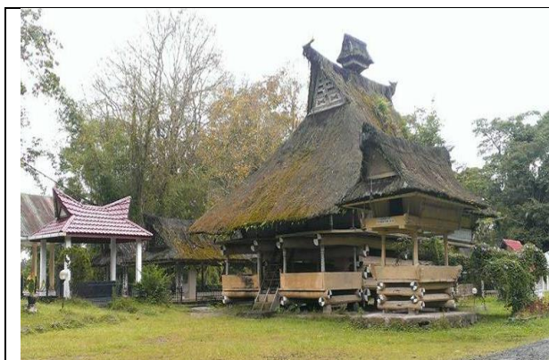
馬達族先人所遺留下來的住屋，由圖可以見到架高的地基及茅草斜屋頂。

反觀台灣原住民的傳統住屋則完全由自然環境來決定住屋型態，與自然緊密結合，配合環境地勢而改變，且就地取材，雖然也會因為一些故事流傳而造成建築型態有所不同，但最大的原因還是為了適應環境，可說是因地制宜的最佳楷模。