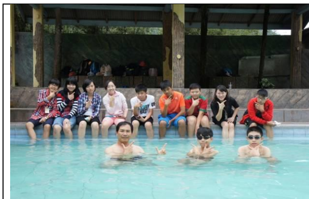
鼓勵學生入境隨俗，勇敢地體驗異地生活