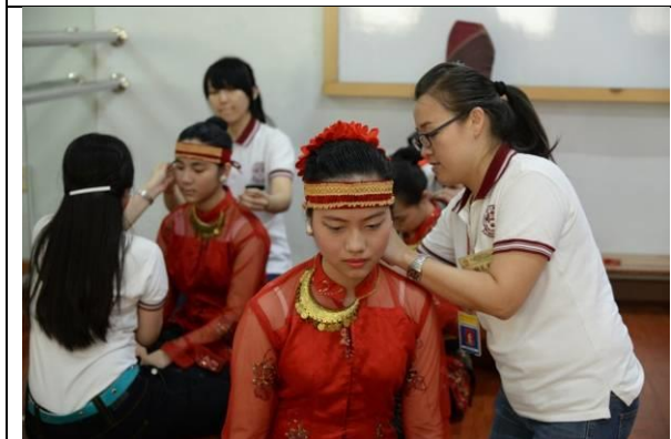
為表演盛裝戴耳環、化妝，十分慎重繁複