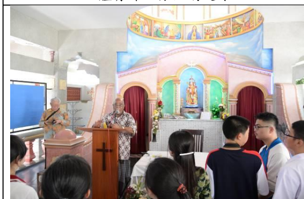
神父講解並領唱聖歌，令同學感受宗教之神聖