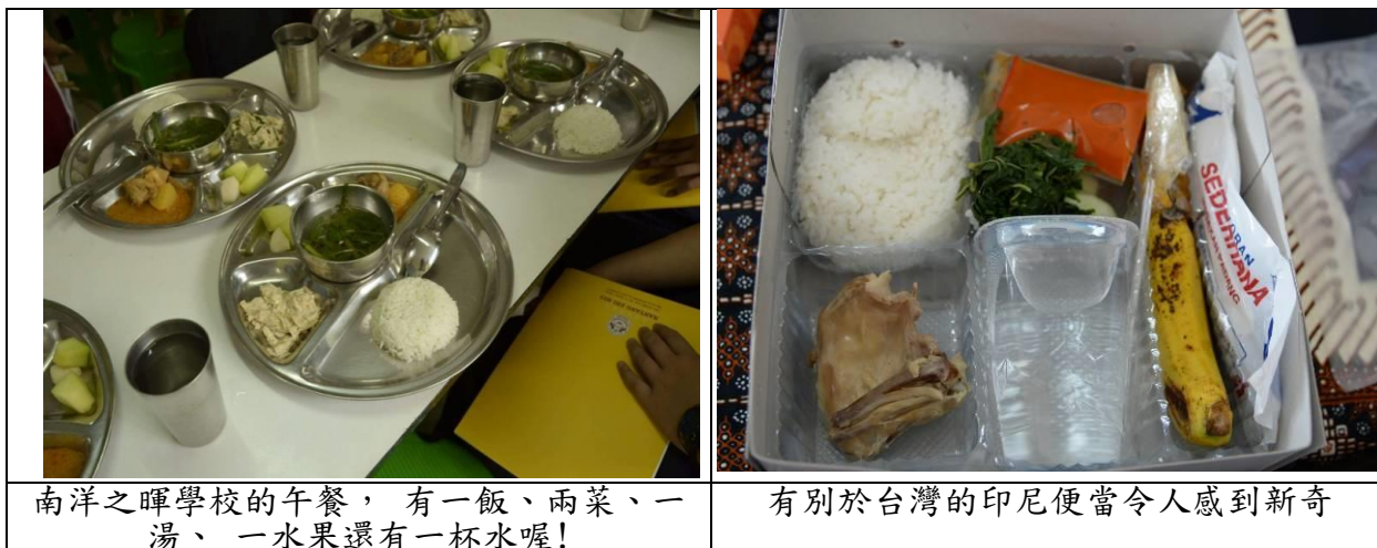
南洋之暉學校的午餐，有一飯、兩菜、一湯、一水果還有一杯水喔！