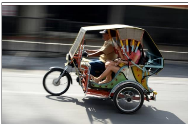
印尼的計程摩托車，依路程遠近付錢

11. 印尼的加油站加油的方式和臺灣加油站加油的方式相同。但鄉下有用飲料罐(約 2 公升瓶裝)分裝販賣。