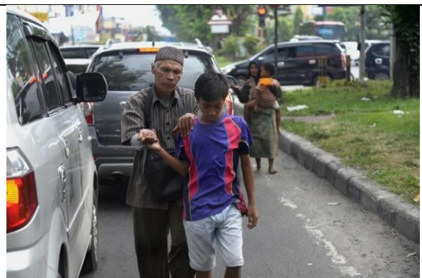
路上隨處可見乞討，貧富差距很大