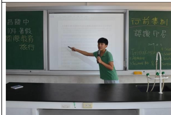
行前報告搜集分享