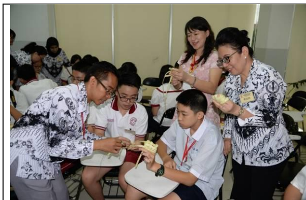
學習印尼傳統民俗技藝~竹編印尼粽子「克杜巴」