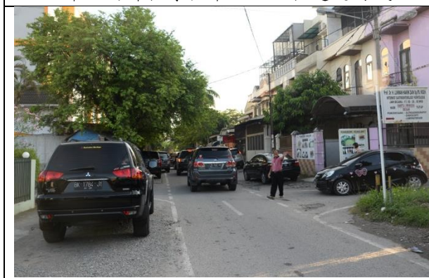
大部分道路左右各只有一線道，塞車的問題嚴重