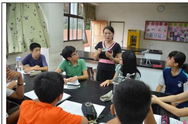
行前集訓~ 主題報告及工作分配